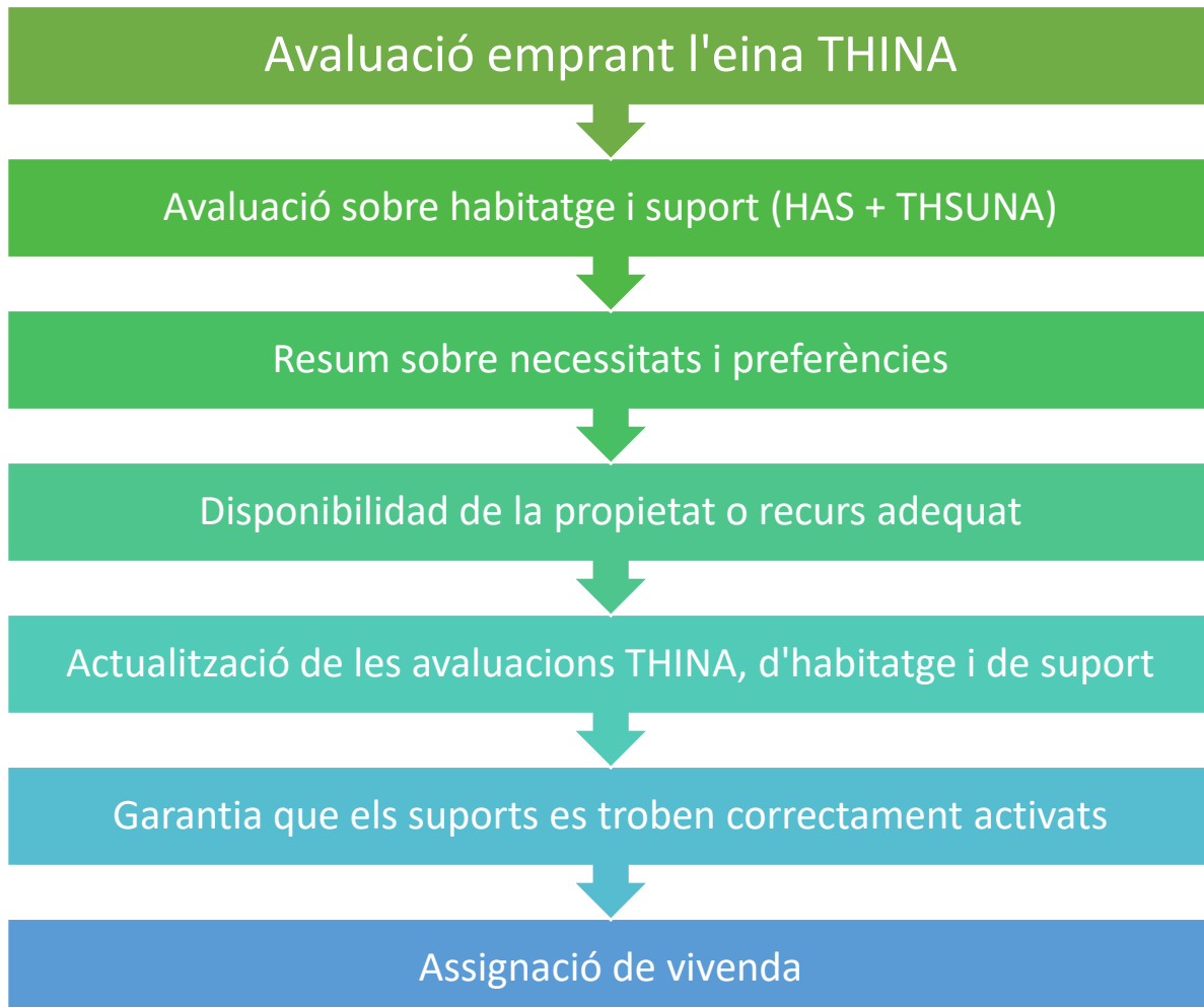
Figura1. Procés integral d'avaluació de Drets, necessitats d'habitatge i suport TopHouse

La següent figura il·lustra visualment el procés de d'avaluació integral TopHouse emprant les eines desenvolupades a través del projecte (THINA, HAS i THSUNA):